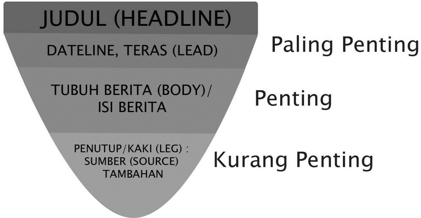
Bagan 1 : Struktur Berita Piramida Terbalik